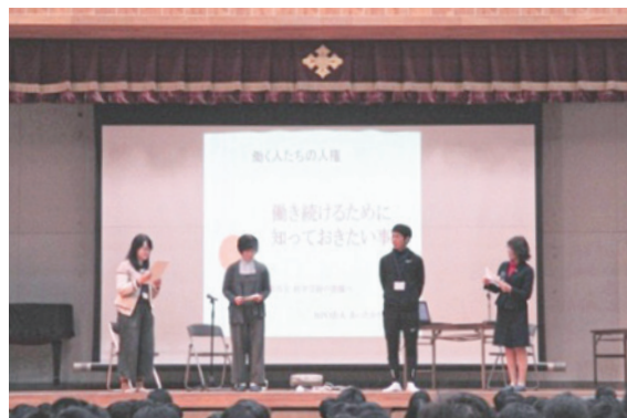
教師と社会保険労務士が協力して熟演し、授業を行っている様子