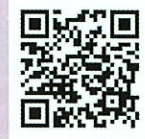
WEB申し込みフォーム